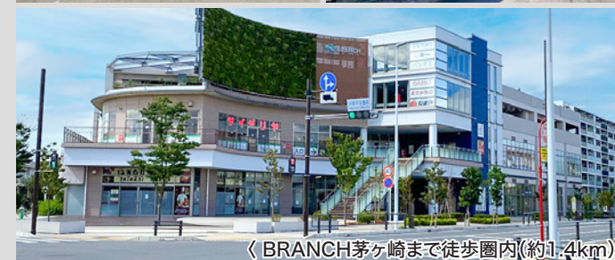
《BRANCH茅ヶ崎まで徒歩圏内(約1.4km)》